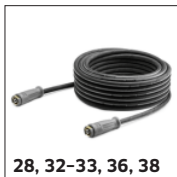
28, 32-33, 36, 38